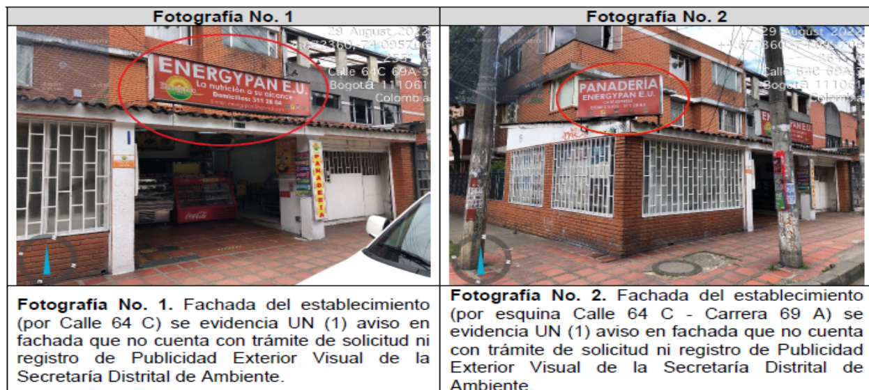
Tabla 3. Registro fotográfico

Valoración técnica y conductas generales evidenciadas (Ver Anexo No. 1. Acta de Visita No. 204772).